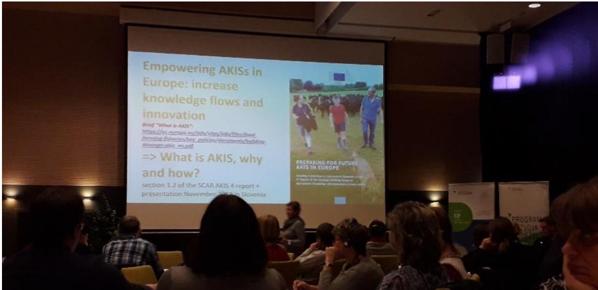
Slika: Povezan sitem inovacij in prenosa znanja v kmetijstvu (AKIS), Inge Van OostT EU komisija