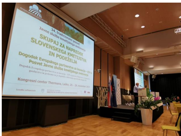
Slika 1: EIP in posvet Posvet Javne službe kmetijskega svetovanja