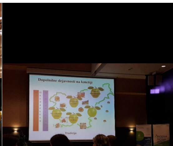
Slika 2: Delavnica, Dopolnilna dejavnost na kmetiji