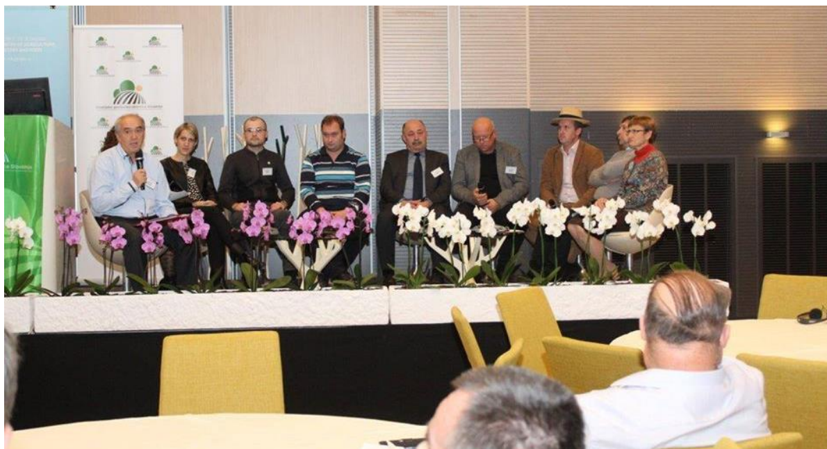
Slika 6: Predstavniki posameznih EIP – okrogla miza