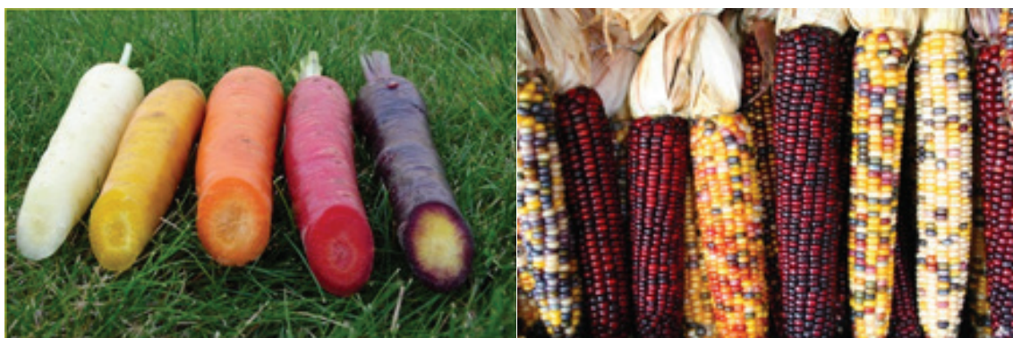
Različne sorte korenja na levi strani, različne sorte koruze na desni.