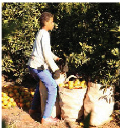
Delavec na plantaži pomaranč – Brazilija